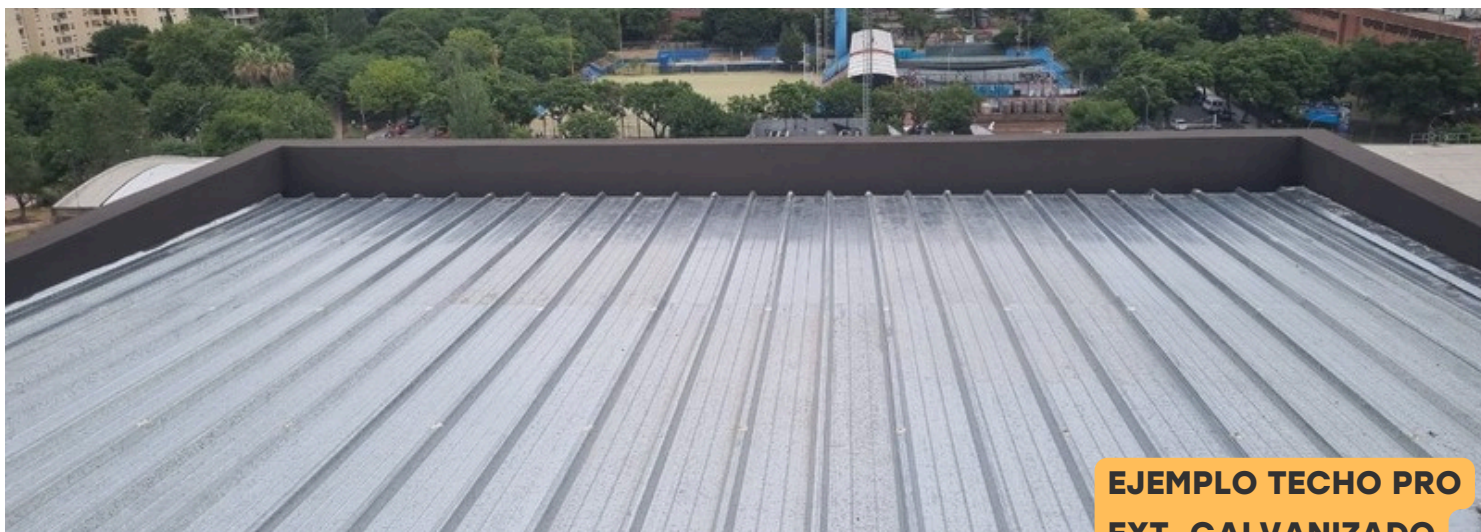
EJEMPLO TECHO PRO EXT. GALVANIZADO