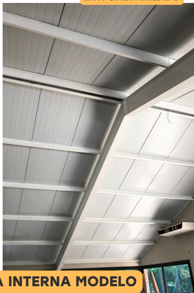
CARA INTERNA MODELO TECHO PRO