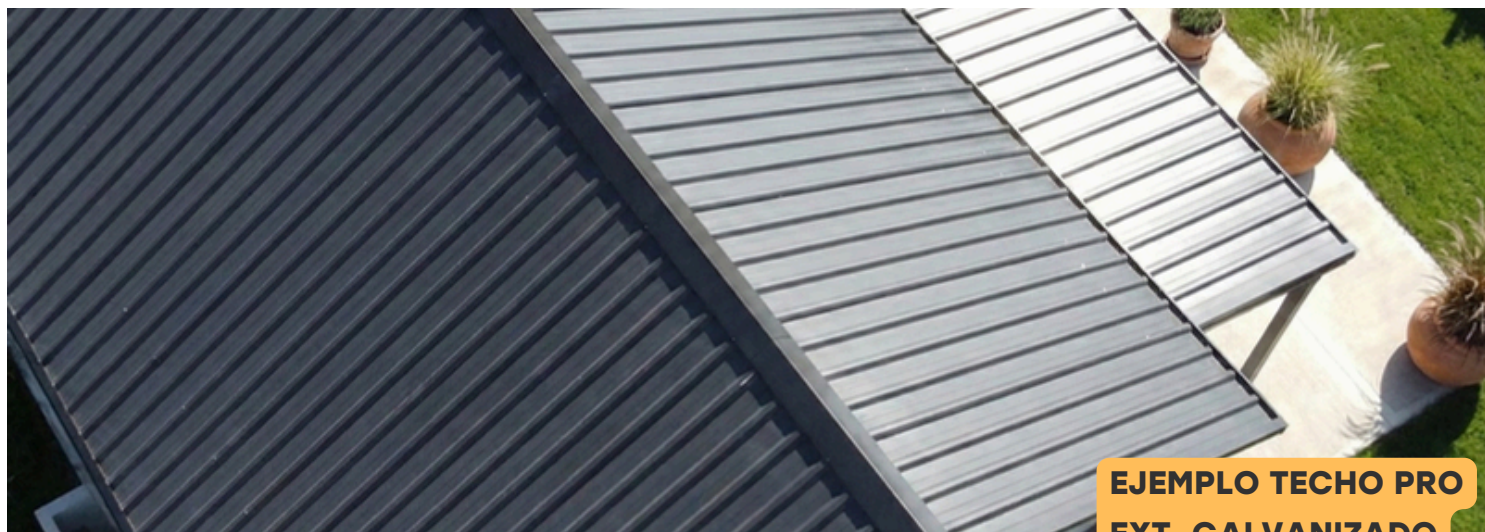
EJEMPLO TECHO PRO EXT. GALVANIZADO