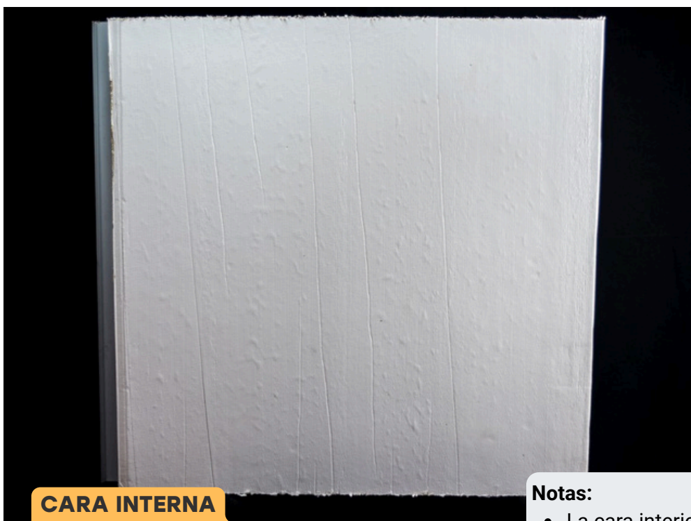
CARA INTERNA MODELO TECHO LITE